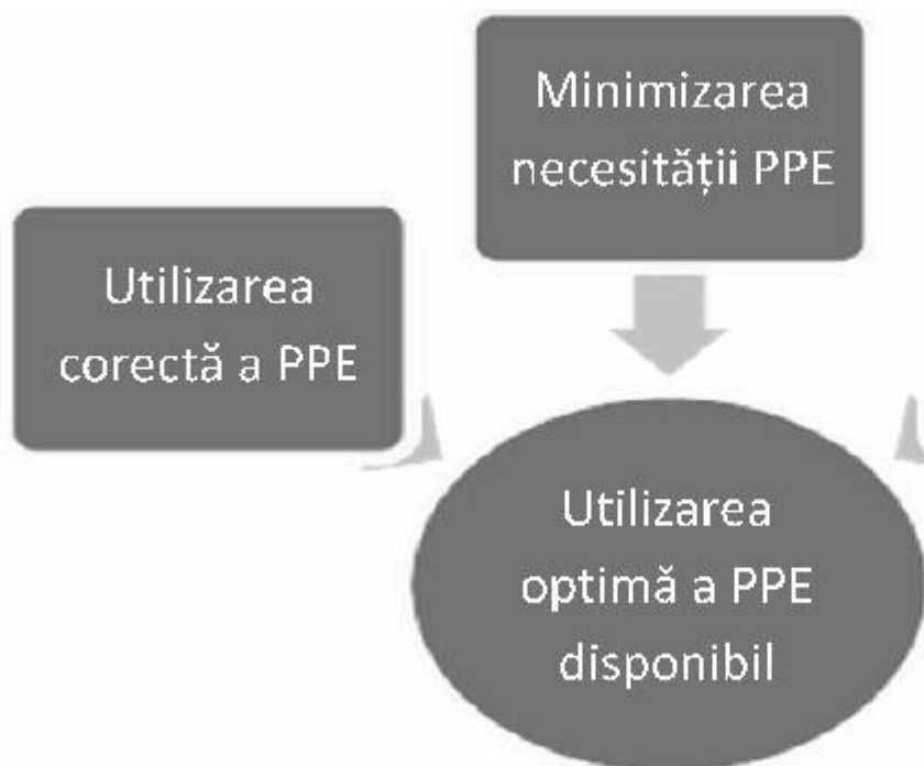
Fig. 1. Strategii de optimizare a disponibilității echipamentului individual de protecție (PPE)

▣ (2) Minimizarea necesității de echipament individual de protecție (PPE)